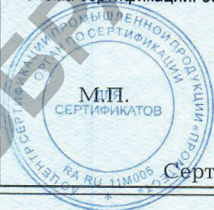
Схема сертификации: Зс.

Место нанесения знака соответствия: на изделии, на упаковке и технической документации.